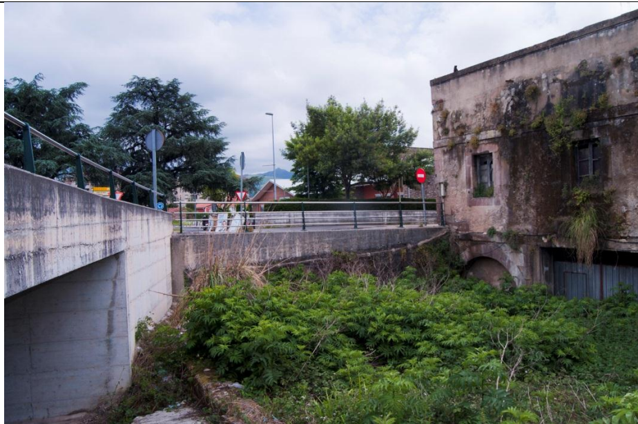
30 T 413557 4797272. Vista de la fachada norte y los arcos de salida del agua.