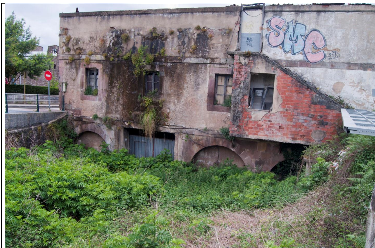
Vista de la fachada posterior con todos los elementos añadidos que hoy la enmascaran... En primer plano parte superior de los arcos de salida del agua hacia el socaz.