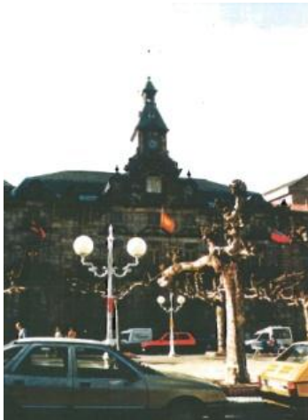
Fotografía del Catálogo 1993